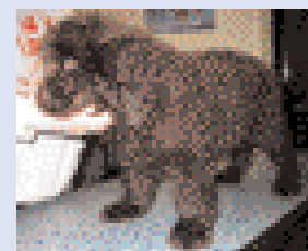
▲ Le jour de la première consultation, le chiot marchait sur le côté du carpe.