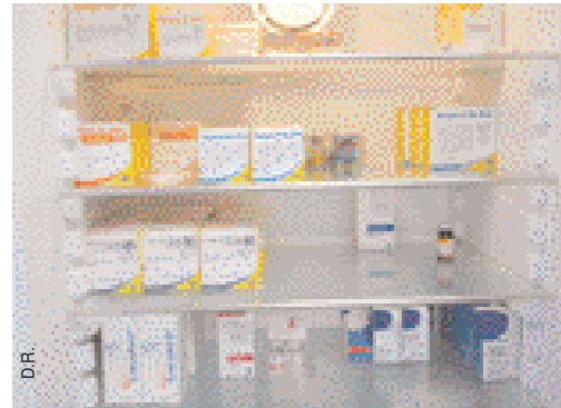
▲ Le respect de la chaîne du froid est un point critique.