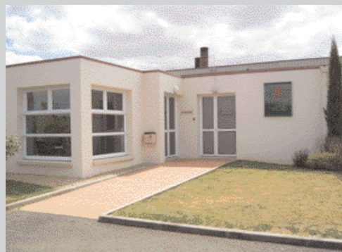
Compagnie d'incinération des animaux familiers

*Ciaf : Compagnie d'incinération des animaux familiers.