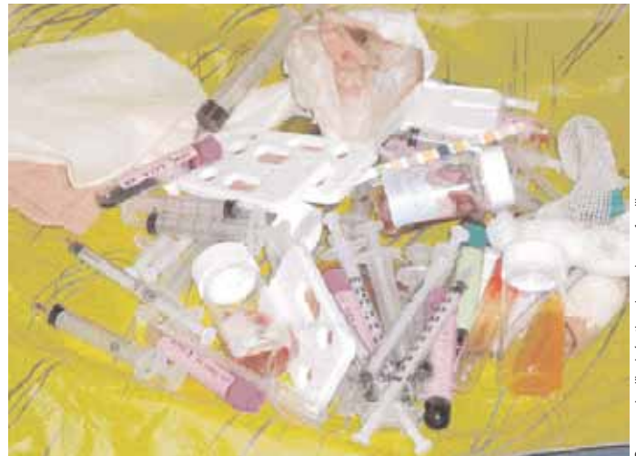
Les déchets spéciaux, à risque infectieux ou traumatique (Dasri), doivent être éliminés de façon à ne pas altérer la qualité de vie des concitoyens.

L'élimination des déchets d'activités de soins revêt également une dimension sociétale puisqu'il faut veiller à ne pas nuire aux personnes qui vont manipuler les déchets. Pour cela, l'intervenant a conseillé d'utiliser des emballages adaptés voire normés, à usage unique, en respectant leur limite de remplissage et conditions de fermeture, en les identifiant, au cas où un problème surviendrait au long de la filière.