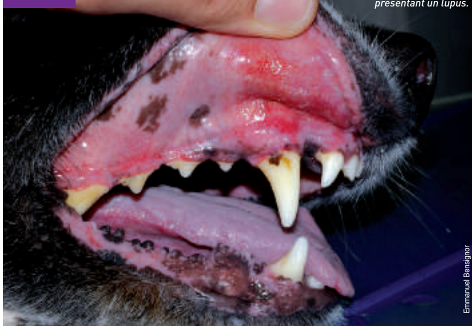
Ulcères buccaux chez un chien présentant un lupus .