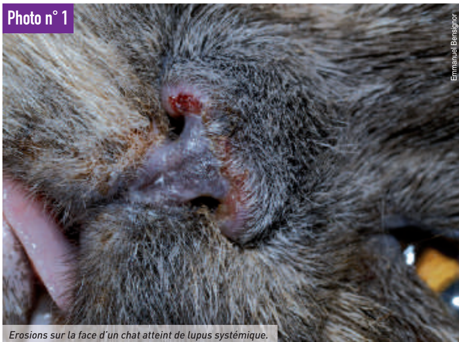
Erosions sur la face d'un chat atteint de lupus systémique.