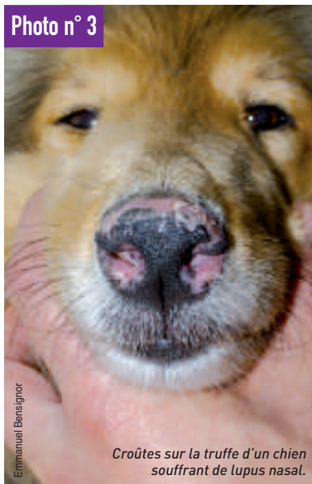
Croûtes sur la truffe d'un chien souffrant de lupus nasal .