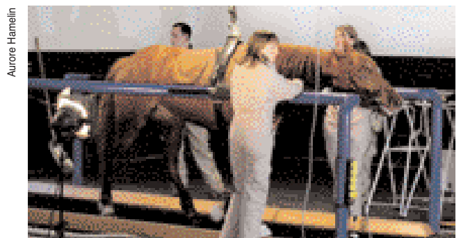
Cheval sur tapis roulant lors du test d'effort au Cirale. Un personnel nombreux doit entourer le cheval pour des raisons de sécurité.