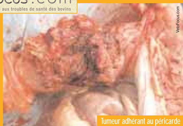
Tumeur adhérent au péricarde