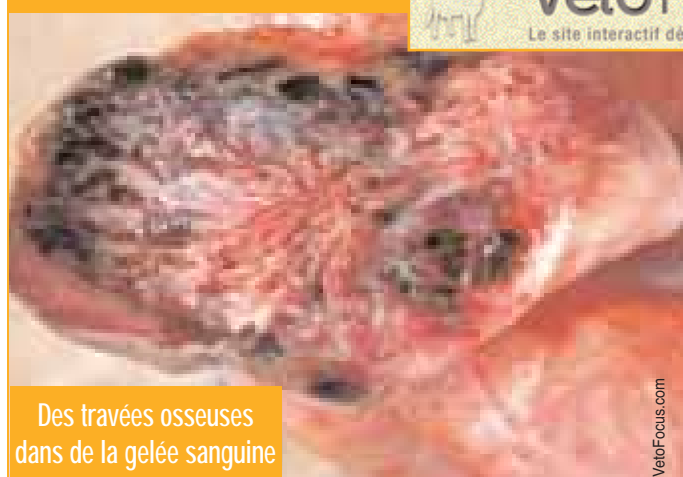
Des travées osseuses dans de la gelée sanguine

Le site interactif dédié aux troubles de santé des bovins