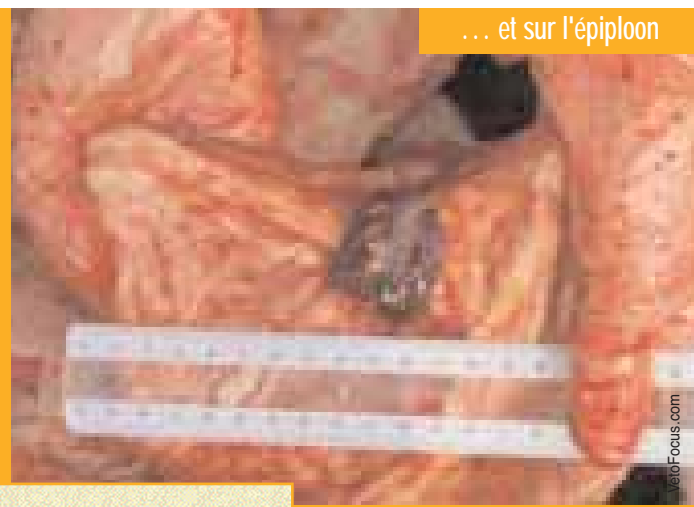
... et sur l'épiploon