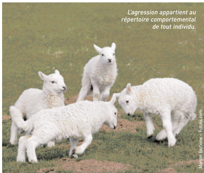
L'agression appartient au répertoire comportemental de tout individu.